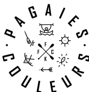
LOGO TYPE A UTILISER

Le logo du niveau pagaie couleur collé sur le pont du bateau. Celui-ci doit être sur fond Blanc et doit mesurer 7 cm de hauteur.